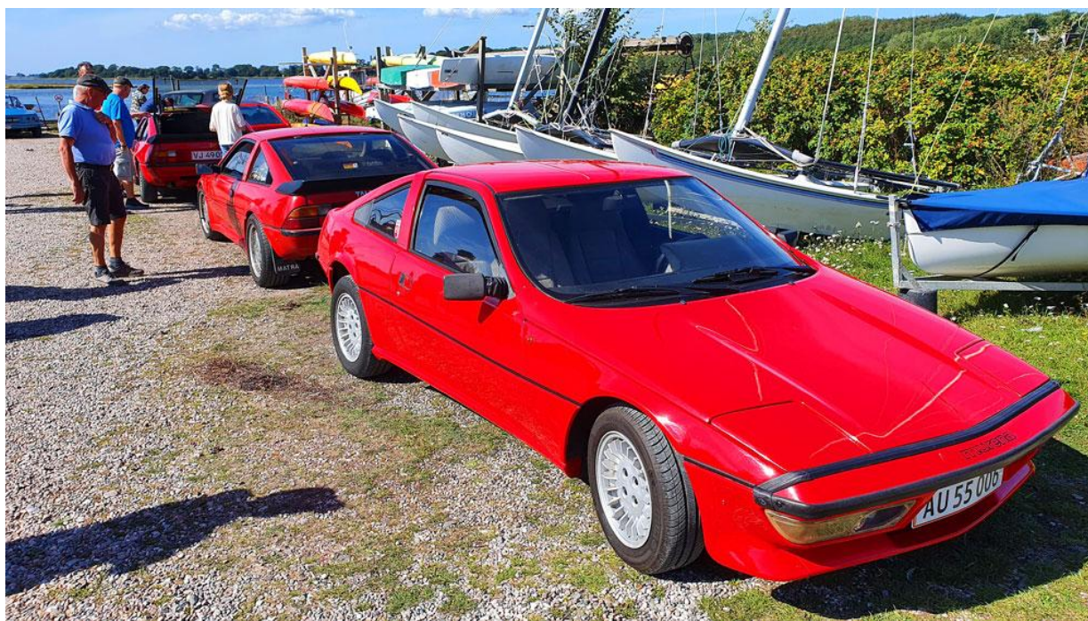
Simca/Talbot Matra på havnen.