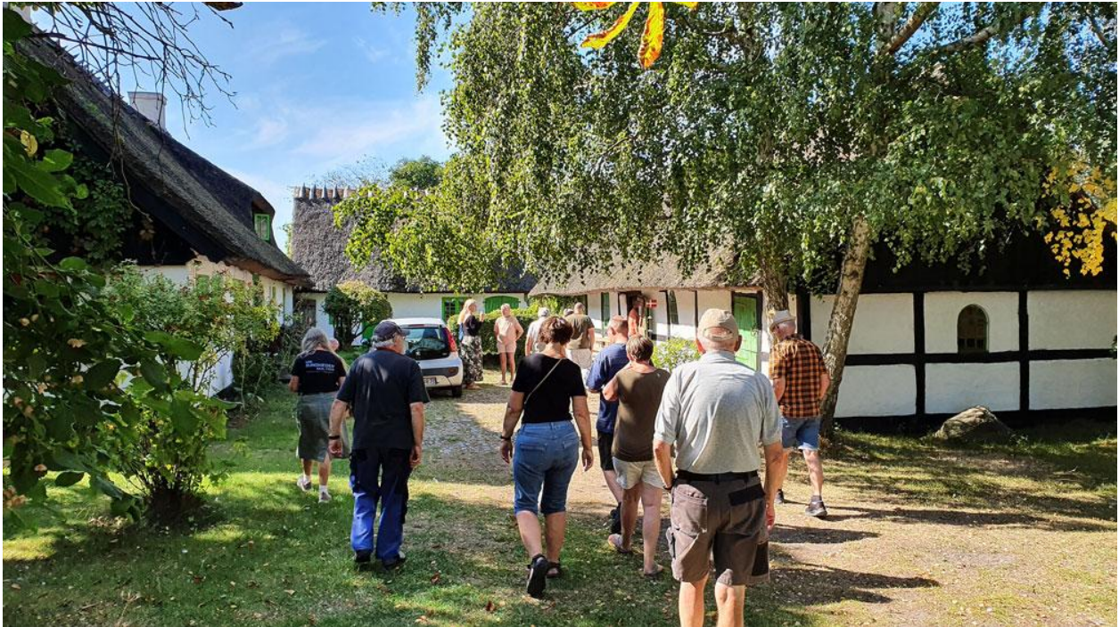
Besøg i et galleri