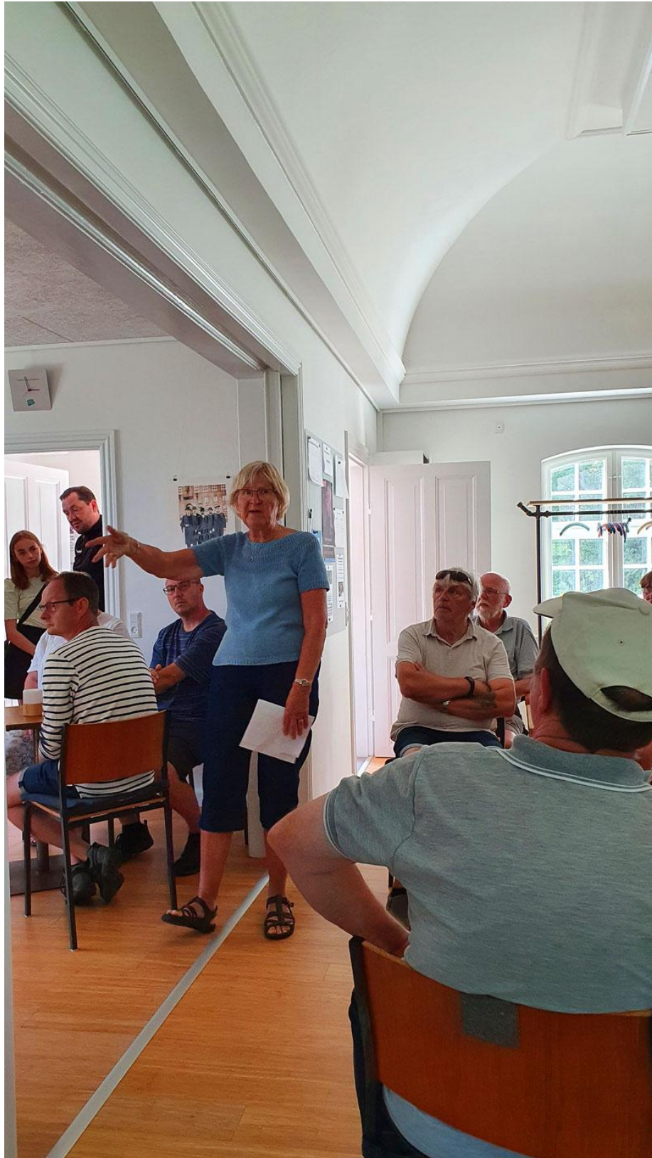
Besøg i Bis'Koppen – et gammelt missionshus som beboerne har sat i stand og som bruges som samlingssted af byens beboere