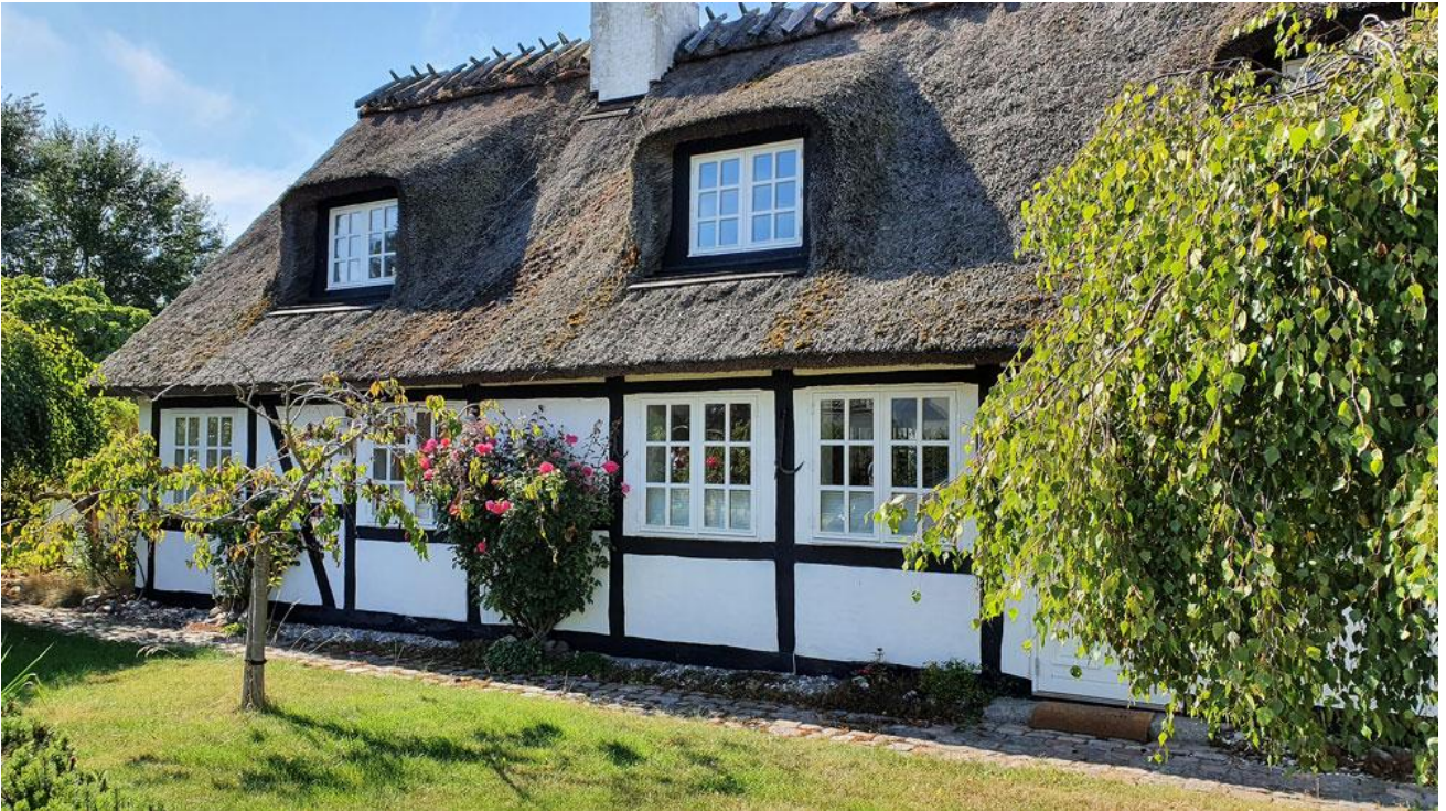
Et af Bisserups idylliske huse