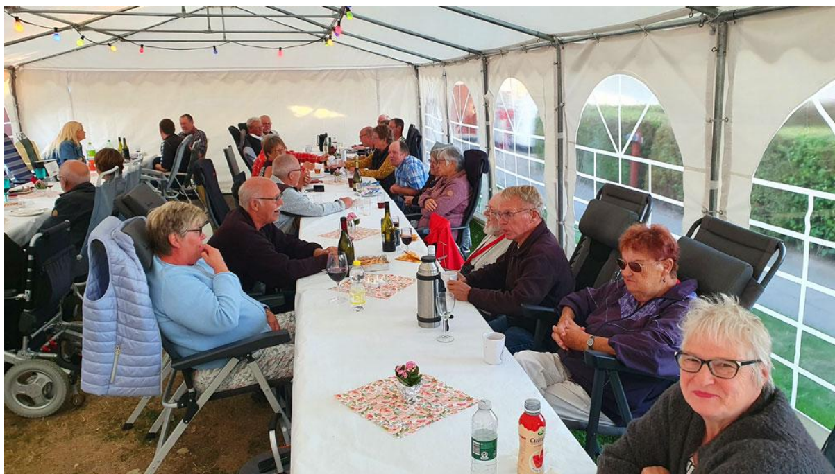
Hygge ved bordene.

Søndag morgen var der som sædvanligt to gratis stykker morgenbrød til alle og kl. 10.00 var der standnedtagning og farvel og tak for denne gang.