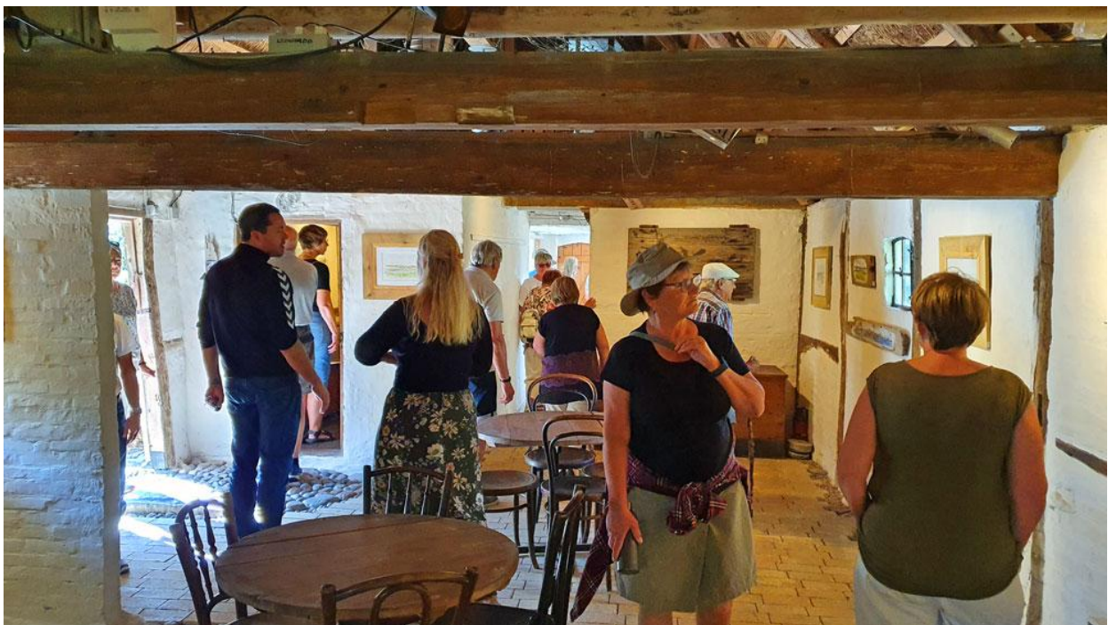
Lidt kultur til BTN'erne