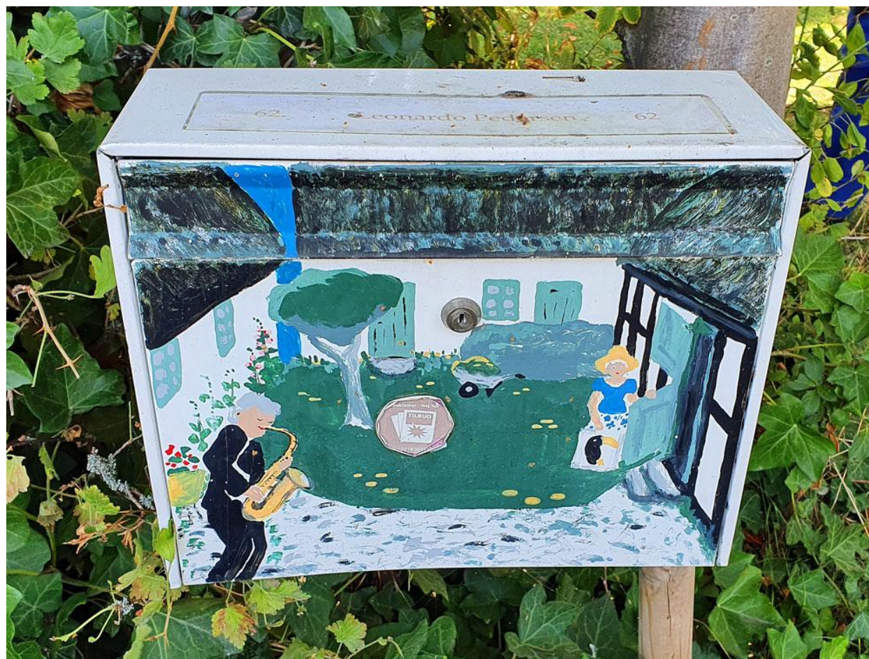
En en Bisserups specielle postkasser