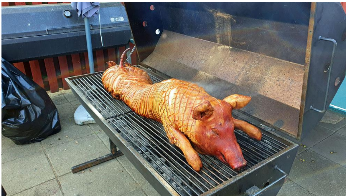
Grisen blev tilberedt professionelt

Kl. 18.00 var der spisning i festteltet med helstegt gris med lækker tilbehør. Campingforeningen Bisserup solgte dejligt Hancock øl til rimelige priser.