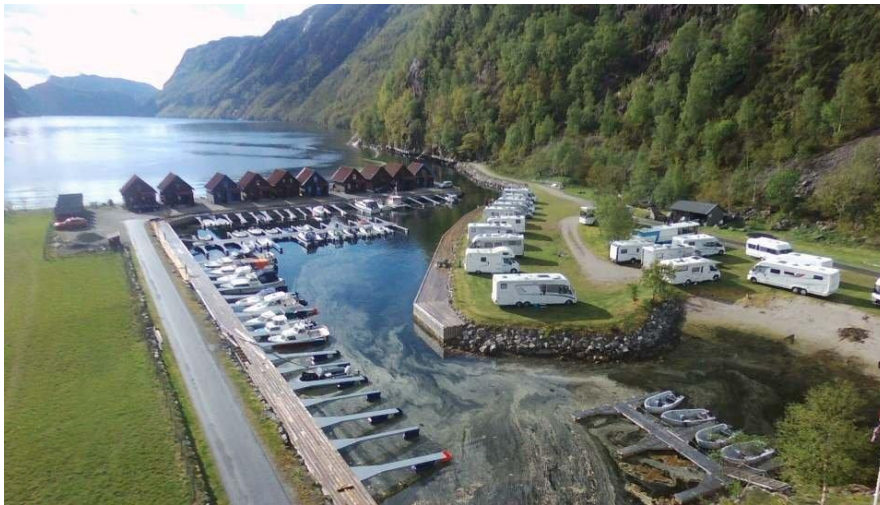
Frafjord Båt og Camping

https://www.norcamp.de/en/norway/fracfjord-bat-camping.2555.1.html