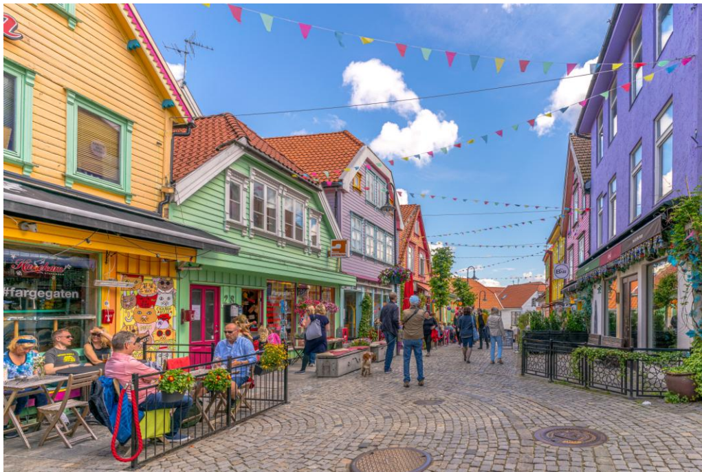
Fargegaten i Stavanger

For de som har lyst kan man tage ind og gå op til Prekestolen eller fra byen tage en båd til Lysefjorden, hvor Prekestolen kan ses fra fjorden.