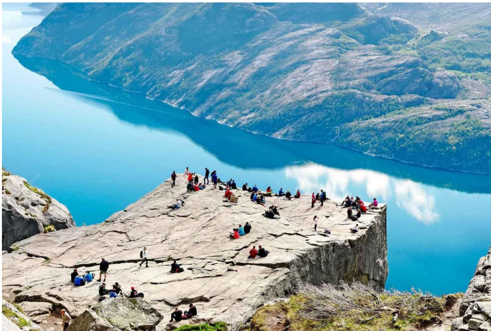
Prekestolen og Lysefjorden