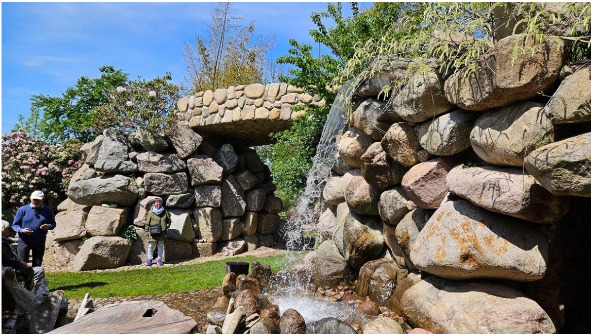
Masser af vand og sten