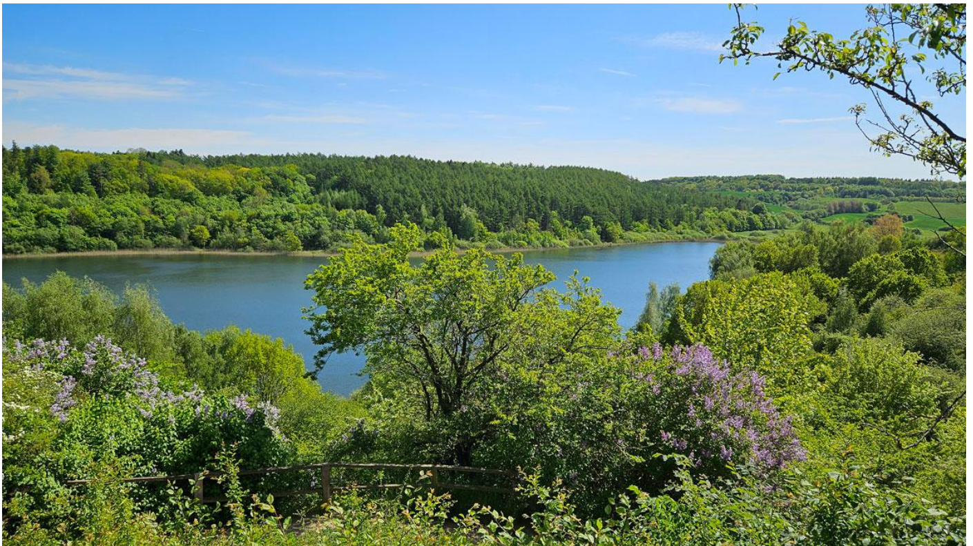
På vejen hjem til campingpladsen var vi forbi den idylliske Maglesø.

Vel hjemme på pladsen gjorde vi klar til fællesspisningen kl. 18.00. Vejret var fint og der var flertal for at lave et langbord udendørs og spise der. Senere gik vi i fællesrummet og drak fælleskaffen.