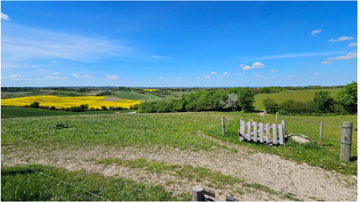
Flot udsigt fra Brorfelde.